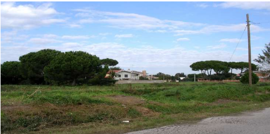
Roma, periferia sud occidentale

Per questo è indispensabile partire dalle origini del fenomeno, indagandone le cause storiche culturali, disciplinari e socioeconomiche.